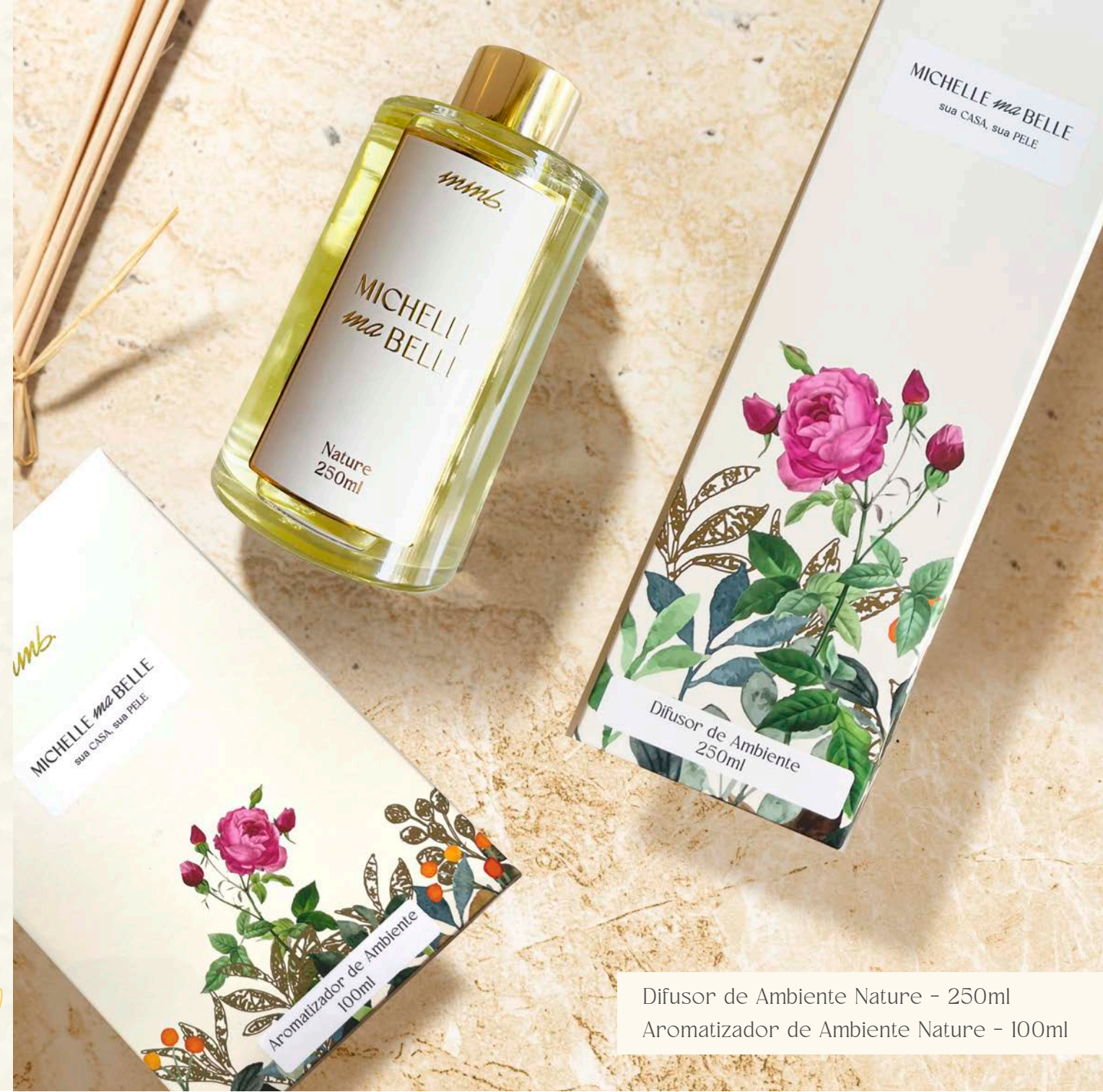
Difusor de Ambiente Nature - 250ml Aromatizador de Ambiente Nature - 100ml