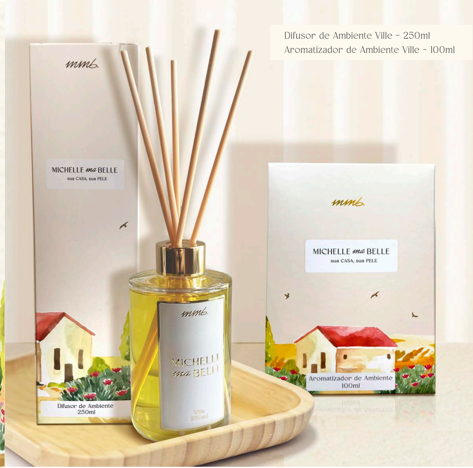
Difusor de Ambiente Ville - 250ml Aromatizador de Ambiente Ville - 100ml